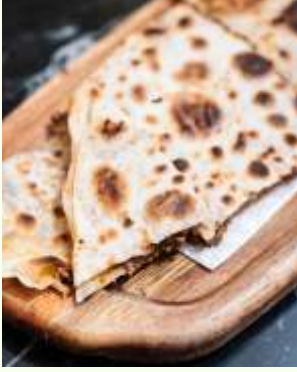
Kiymalı Gözleme Turkish Meat Quesadilla 520₺