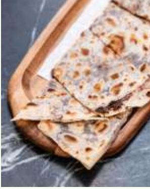
Nutellalı Gözleme Turkish Nutella Quesadilla 460₺