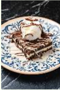
White Choco. Brownie