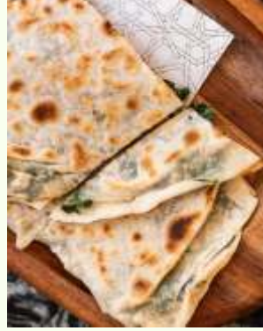
Ispanaklı Gözleme Turkish Spinach Quesadilla 460₺