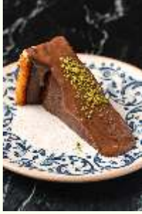
San Sebastian Cheesecake