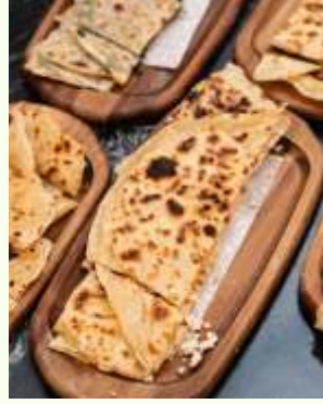
Karışık Gözleme Turkish Mix Quesadilla 480₺