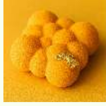
Passion Fruit Mousse