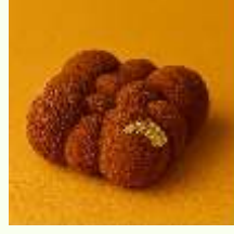
Chocolate Mousse Frambuaz