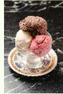
Ice Cream Cup