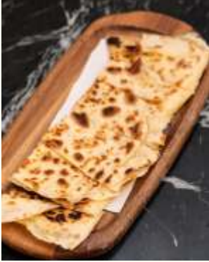
Kaşarlı Gözleme Turkish Kashar Cheese Quesadilla 490₺