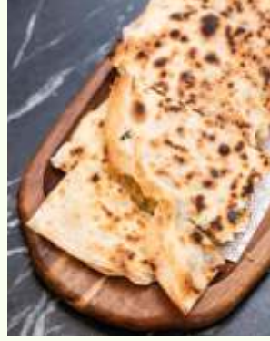
Patatesli Gözleme Turkish Potato Quesadilla 460₺