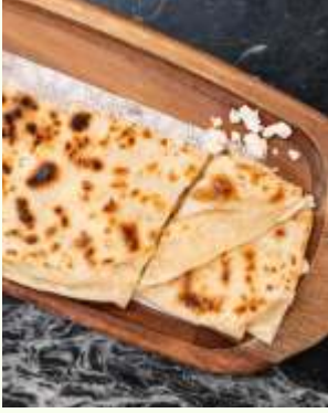
Peynirli Gözleme Turkish Cheese Quesadilla 490₺