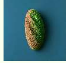
Chromia Pistachio Mousse