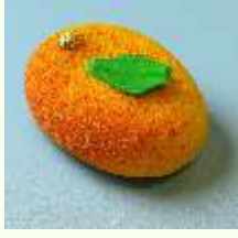
Mango Lime Mousse Cake